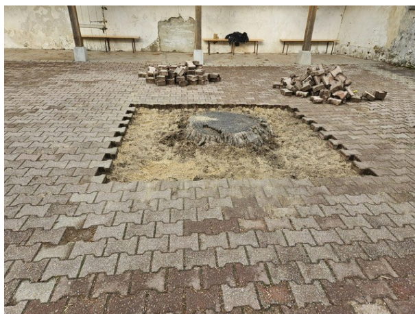
DESSOUCHAGE DANS LA COUR DE L'ÉCOLE