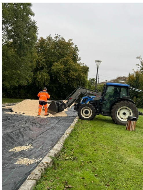
RÉNOVATION DU TERRAIN DE PÉTANQUE