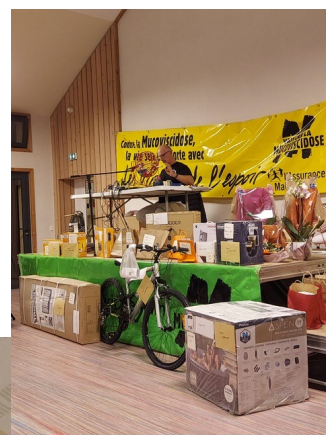
LOTO 15 NOVEMBRE 2025