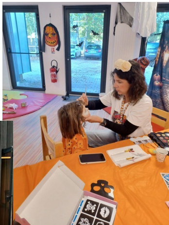
LUDOWEEN 18 OCTOBRE 2025