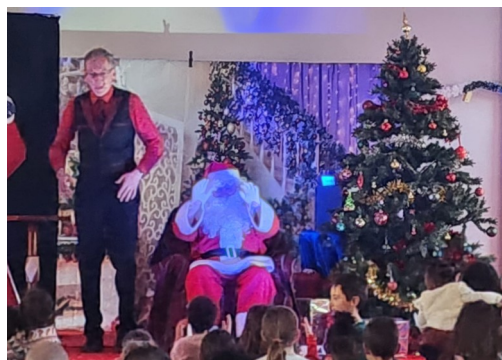
ARBRE DE NOËL 06 DÉCEMBRE 2025