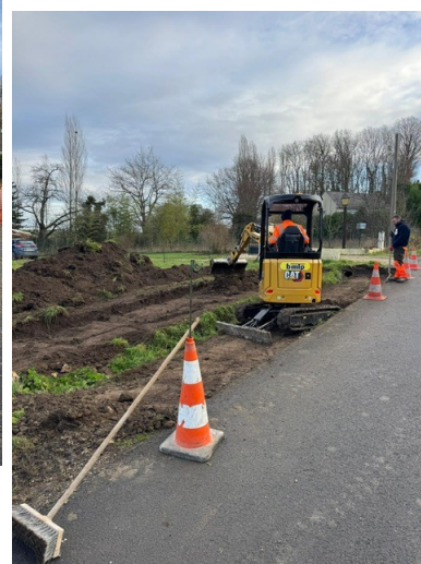
PRÉPARATION DU TERRAIN POUR LA MISE EN PLACE D'UNE BÂCHE INCENDIE RUE DE PERREUSEE