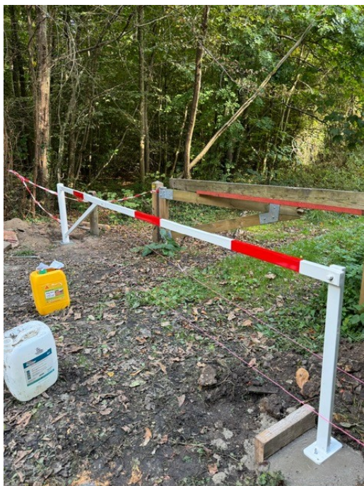
REPLACEMENT DE LA BARRIÈRE DE LA FORÊT DES USELLES