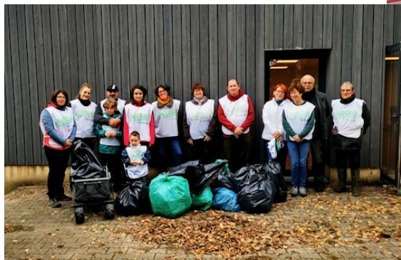
NETTOYONS LA NATURE 19 OCTOBRE 2025